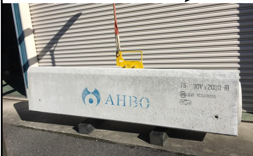
⑤地切り時水平確認してください。水平度が悪ければ一旦降ろして、吊具のかかりを確認してください。