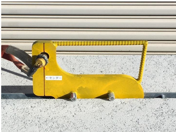
③吊具側面の突起が当たるまで落とし込みます。